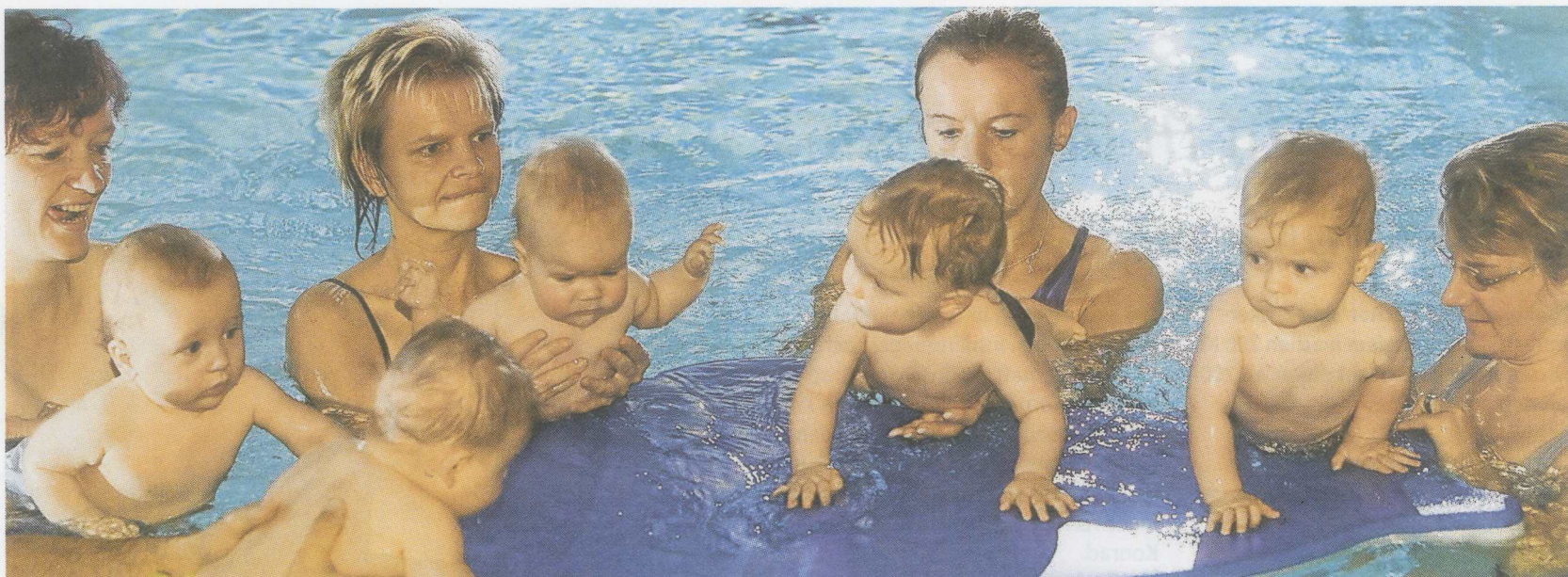
Bereits seit 13 Jahren bietet die Reha Vita in Cottbus das Babyschwimmen an. Die Kurse, in denen Babys ab einem Alter von drei Monaten ihre Mobilität im Wasser erproben können, sind sehr beliebt. Eine frühzeitige Anmeldung empfiehlt sich.