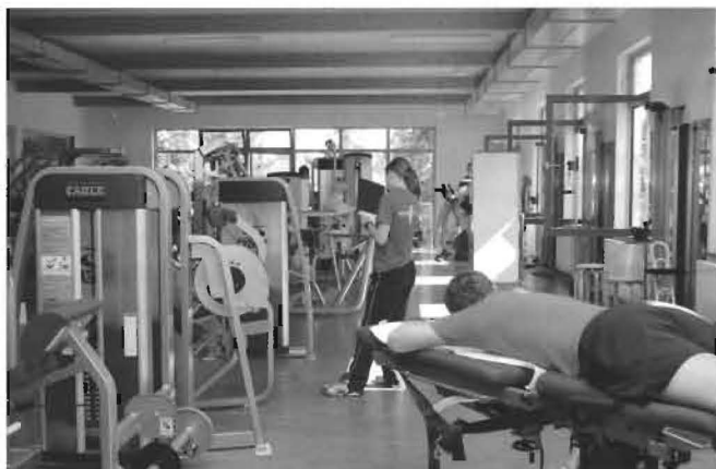
Die Medizinische Trainingstherapie (MTT) wurde auf 380 Quadratmeter vergrößert.

Das Cottbusser Familienunternehmen Reha Vita zählt zu den Top 100 der besten Arbeitgeber in Deutschland. Mit der räumlichen Erweiterung verbessern sich für die Mitarbeiter im ärztlich-therapeutischen Bereich aber auch in der Verwaltung die Arbeitsbedingungen. Großzügige Behandlungs- und Arzträume, ruhigere Arbeitsplätze in der Verwaltung, moderne Ausstattungen in der Therapie - ein großer Teil der Investitionen dient der Schaffung eines attraktiven Umfelds, das im unternehmerischen Selbstverständnis des Hauses ein entscheidender Schlüssel für den wirtschaftlichen Erfolg ist. m-r .