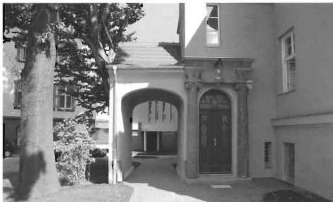
Sorgfalt im Detail: Restaurierte Holztür an der Villa.

Ausbau ganzheitlicher Angebote, der psychologischen Betreuung sowie von Kursmöglichkeiten. Umfangreiche Angebote in Therapie, Training und Prävention bilden Kernkompetenzen des Hauses, die weiter entwickelt und zu einer noch engeren Patienten- und Kundenbindung führen sollen.