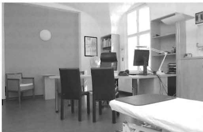
Attraktive Arbeitsplätze für das medizinische Personal.

Das Cottbusser Familienunternehmen Reha Vita zählt zu den Top 100 der besten Arbeitgeber in Deutschland. Mit der räumlichen Erweiterung verbessern sich für die Mitarbeiter im ärztlich-therapeutischen Bereich aber auch in der Verwaltung die Arbeitsbedingungen. Großzügige Behandlungs- und Arzträume, ruhigere Arbeitsplätze in der Verwaltung, moderne Ausstattungen in der Therapie - ein großer Teil der Investitionen dient der Schaffung eines attraktiven Umfelds, das im unternehmerischen Selbstverständnis des Hauses ein entscheidender Schlüssel für den wirtschaftlichen Erfolg ist. m-r .